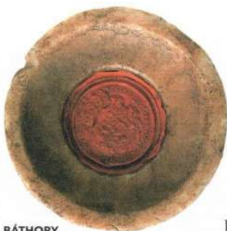
BÁTHORY ISTVÁN PECSÉTJE (1576–1586)

vagyonára és az uralkodói bevételekre. Erdély urai többségükben a partiumi területek gazdag földesurai közül kerültek ki, akiknek anyagi erejével kevesen vetekedhettek. Emellett Erdélyben a kincstár volt a legnagyobb birtokos, ezért a legjelentősebb várak a hozzájuk tartozó kiterjedt uradalmakkal együtt szintén a fejedelem kezén voltak. A kincstárt gazdagították továbbá az iparból, kereskedelemből és a fejedelmi monopóliumokból – például bányászat, pénzverés, arany- és ezüstbeváltás, só, ló, szarvasmarha stb. kivitele – befolyó jövedelmek. A fejedelemség 16. századi bevételeiről nincsenek pontos adataink, általában évi 300 000 aranyra szokás becsülni, de ebben az összegben nincsenek benne a kincstári birtokok jövedelmei. Ha mindehhez hozzáadjuk a fejedelmek mögött álló török támogatást, úgy tűnik, hogy a fejedelmi hatalommal senki nem rivalizálhatott.