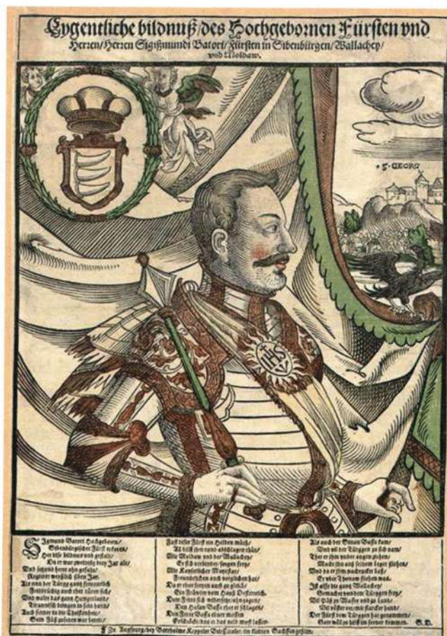
BÁTHORY ZSIGMOND, ERDÉLYI KATOLIKUS FEJEDELME (SZINEZETT FAMEZSET, 1595)

Bár minden fejedelem szerette volna saját felekezetét államvallássá tenni, erre nem nyílt lehetőség, így maradt fent Erdélyben másfél évszázadon keresztül az egész Európában páratlan tolerancia és vallási sokszínűség.