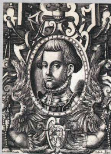
JÁNOS ZSIGMOND ARCKÉPE (NICCOLO NELLI KORABELI RÉZMETSZETE)

A János Zsigmond név a lengyeleknél bukkant fel – I. Zsigmond király a fia (Zsigmond Ágost) és az unokája (János Zsigmond) esetében is ragaszkodott saját keresztneve megjelenéséhez. Mivel a Habsburgokkal folyó tárgyalásokon a lengyel király képviselte unokája érdekeit, a bécsi udvar a lengyel névhasználatot vette át. Ennek megfelelően Istvánffy Miklós humanista történetíró és politikus – aki az 1560-as években még a kancellárián dolgozott – A magyarok dolgairól című történetében szintén János Zsigmondként szerepeltette Erdély urát. Az ő munkájának köszönhetően a tör-