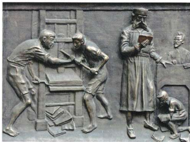
Méliusz Juhász Péter (1532–1572) Somogy megyéből származó protestáns egyházi író, hitvitázó, 1561-től debreceni református püspök. Ifjúkorában először a lutheri, majd Szegedi Kis István hatására a helvét reformáció követője lett. A magyarországi református egyház megszervezője.