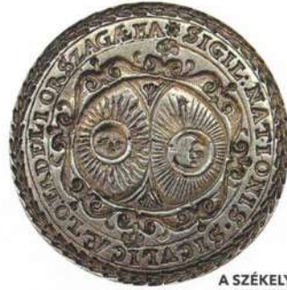
A SZÉKELY NEMZET PECSÉTNYOMÓJA (1659)