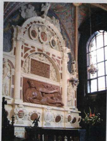
BÁTHORY ISTVÁN SÍRJA A WAWEL- SZÉKESEGY- HÁZBAN

Miután megreformálta és korszerűsítette a hadsereget, a Balti-tenger keleti partvidékének birtoklásáért zajló livóniai háborúban, 1579–1581 között három nagy hadjáratban visszaszorította IV. (Rettegett) Iván cárt. Utolsó éveiben törökellenes haditerveken dolgozott, a Vatikán és Európa nagy része benne látta a kereszténység bajnokát, aki majd legyőzi a keleti sárkányt, ebben azonban váratlan halála megakadályozta. A lengyelek három legnagyobb királyuk közé sorolják.