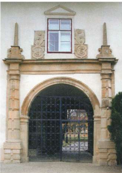
A GYULAFEHÉRVÁRI FEJEDELMI PALOTA BEJÁRATA

Az országgyűlés rendszeresen, általában évente kétszer ülésezett, mégsem tudott olyan befolyásos, megkerülhetetlen intézménnyé válni, mint a királyi Magyarországon. Az országgyűlés csak egykamarás volt, a magas kormányzati tisztséget viselők mellett a törvényhatóságok és városok követői, valamint a fejedelmi meghívólevéllel meghívottak, az ún. regalisták vehettek részt rajta. Utóbbiak száma az uralkodótól függött, aki ezáltal még a feszültebb időszakokban is könnyedén teremthetett magának kényelmes többséget. A hatalmi játszmáktól eltekintve az uralkodói meghívókra azért volt szükség, mert így a gyűlésen részt vehettek az éppen tisztség nél-