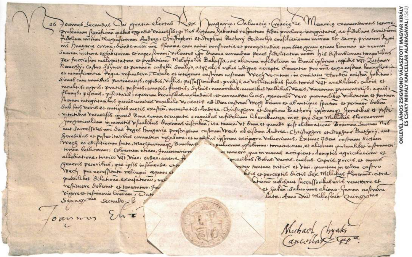
OKLEVEL JÁNOS ZSIGMOND VÁLASZTOTT MAGYAR KIRÁLY ÉS CSAKY MIHÁLY KANCELLÁR ALÁÍRÁSÁVAL (1562)

küli főurak, illetve az egyes kérdések szakértői is. Ilyenek voltak például a püspökök és más egyházi emberek, akiket a vallásügyi tárgyalásokra hívtak meg. A fejedelemségben ugyanis az állam és az egyház már korán szétvált a katolikus egyház meggyengülése miatt. Erdély két püspöksége közül a gyulafehérvárit a fejedelmi udvar foglalta el, a váradi pedig Fráter György halálával megszűnt, jövedelmeit az Erdély kulcsát jelentő váradi vár fenntartására fordították.