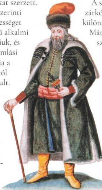
SZÁSZ POLGÁRMESTER EGY 17. SZÁZADI VISELETKÓDEXBŐL

A szászok Erdély leggazdagabb és legzárkózottabb rendjét alkották. Politikai különállásukat a II. Andrástól és Hunyadi Mátyástól kapott privilégiumoknak köszönhetően tudták megteremteni,