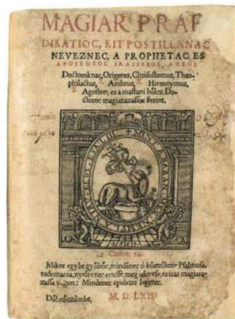
MÉLIUSZ JUHÁSZ PÉTER: MAGYAR PREDIKÁCIÓK (DEBRECEN, 1563)

Számos radikális irányzat is megjelent, közülük egyedül a szentháromság-tagadók (a későbbi unitáriusok) tudtak szilárd egyházzá szerveződni. Ebben döntő szerepet játszott a rendkívül szuggesztív Giorgio Biandrata, aki hite miatt Itáliából Svájcra és Lengyelországra át végül Erdélybe menekült, és itt előbb Izabella királyné nőgyógyászaként, majd az uralkodó és a politikai elit