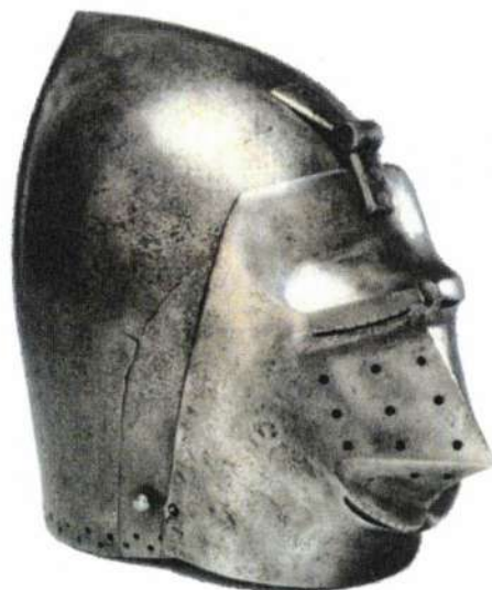
Arcvértes tornasisak, amelyhez eredetileg a vállat védő sodronyvért csatlakozott (14. század)

élelem elfogyott, helyszíni beszerzéssel, rekvirálással pótolták. Esetenként már a csata közben kiváltak egyesek a hadrendből, s elkezdték az ellenség táborát, a környék lakosságát fosztogatni. Ezt a hadvezetés általában „elnézte”, a szigorú büntetés könnyen az egész sereg felbomlásához vezethetett volna. (Persze az ellenség sem viselkedett másként.) Elvileg a katonának – főleg ha zsoldos volt – kellett a saját és beosztottai ellátásáról gondoskodnia. Drága fegyverzetét is saját magának kellett beszereznie. A zsold azonban bőséges volt (persze ha idejében kifizették...). Egy ló és a fegyverzet 15-20 aranyba is került Itáliában. Egy lovas katona havi 5-8 aranyat kapott – amikor egy bolognai egyetemi professzor havi 6 aranyat.