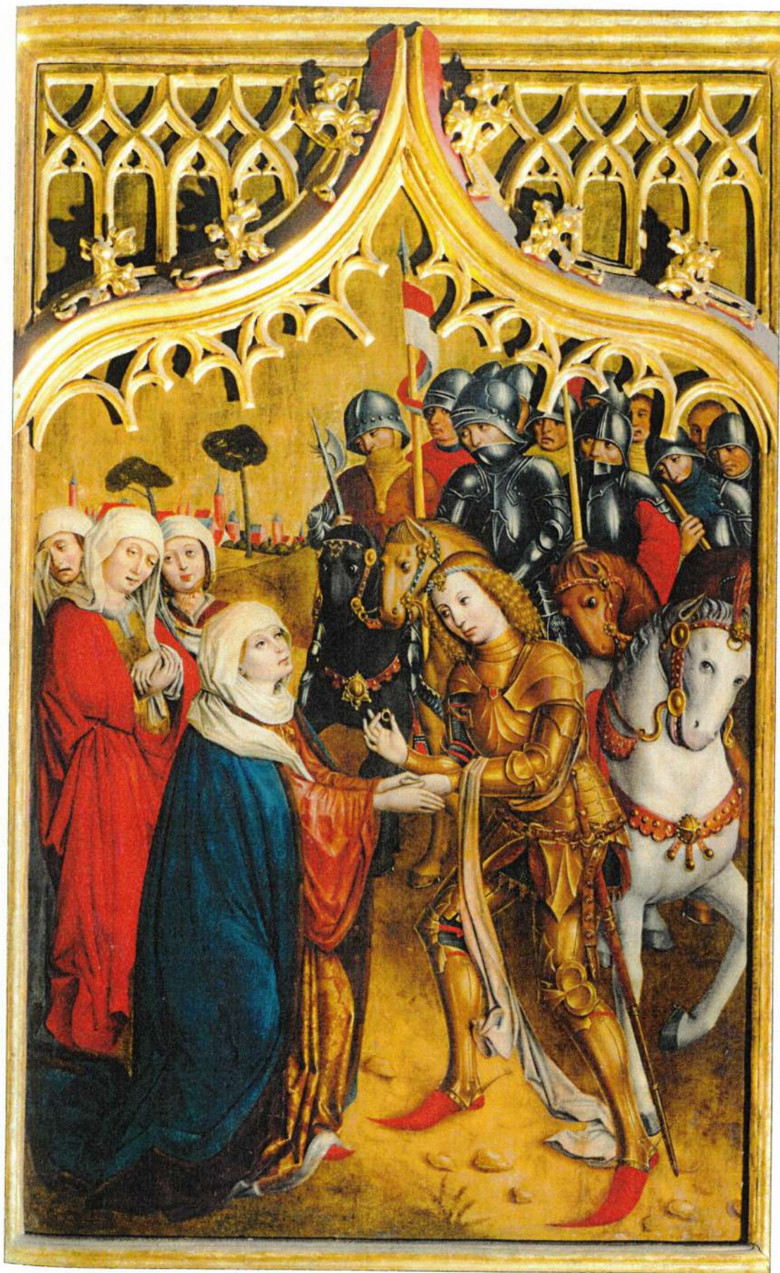
Lovag búcsúzik szeretteitől, mögötte bandériuma várakozik. (Részlet a kassai Szent Erzsébet székesegyház 1470 körül készült, szárnyas oltáráról, amely II. András lánya, a később szent avatott Erzsébet életének jelenete örökítette meg)